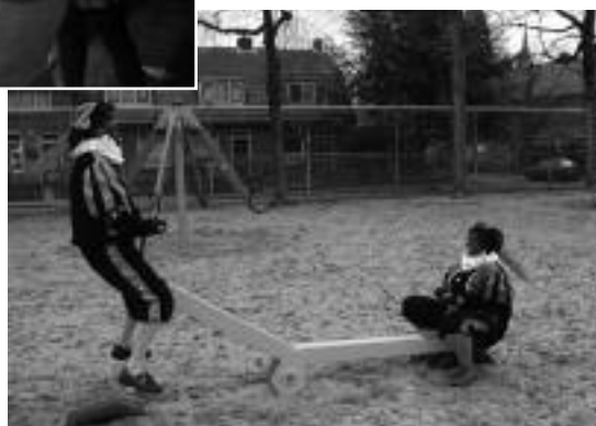
Speeltuin Beetsplein 3 december