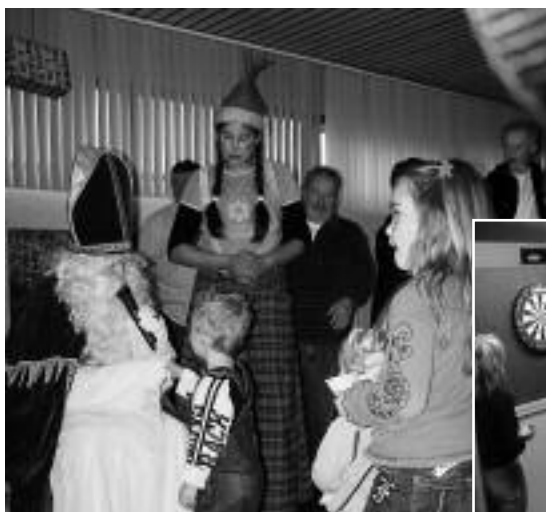
De Vrijbouter 26 november