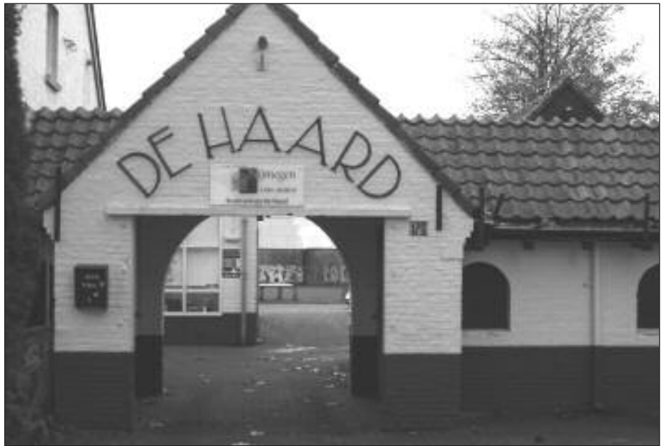
De Haard.