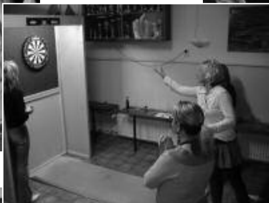
Darttoernooi De Haard 15 oktober