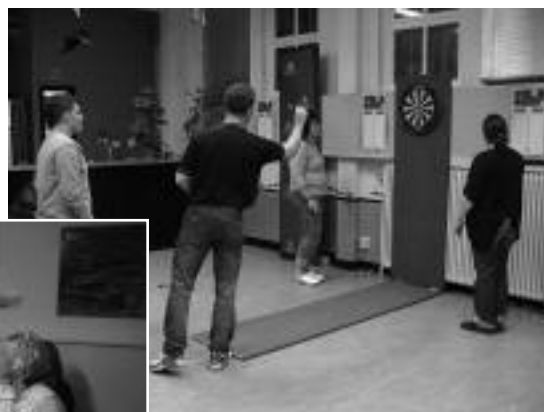
Darttoernooi De Inloop 29 oktober