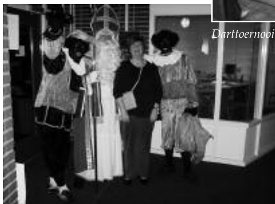
Klokketoren 30 november