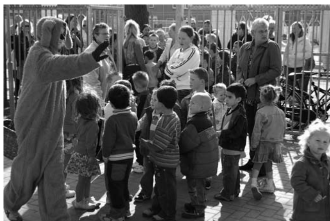
Een zonnige Paashaas op het Beetsplein in het Willemskwartier