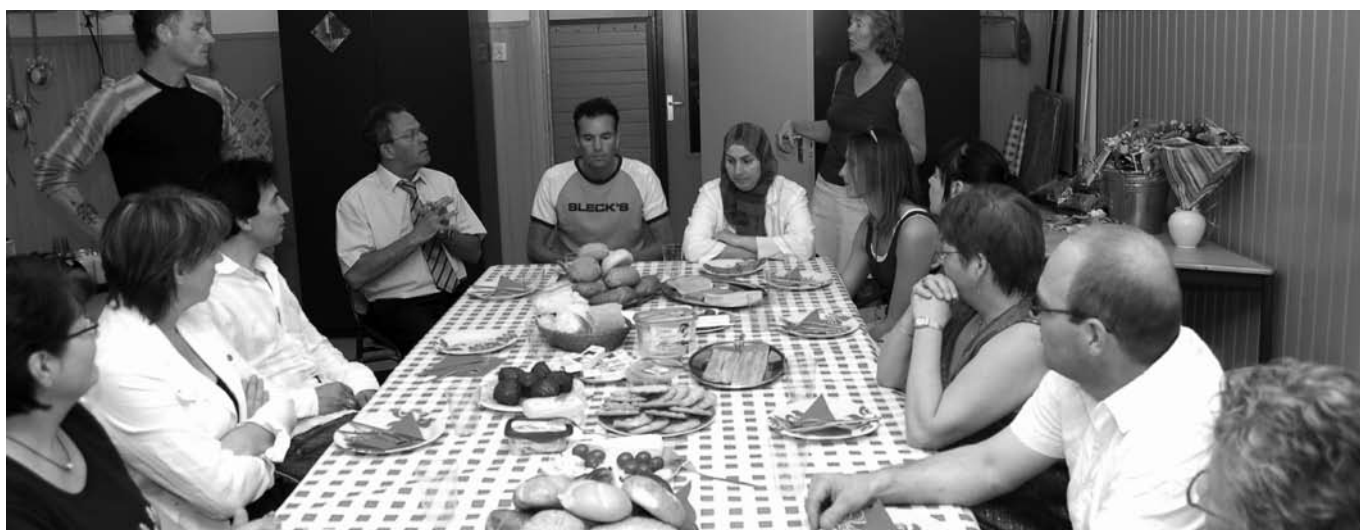
Feestelijke lunch in De Haard